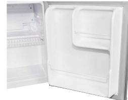
Türablagen Die praktischen Türablagen sorgen für mehr Ordnung im Kühlschrank.