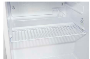
Zwischenablage Optimale Aufteilung des Kühlraums für mehr Ordnung.