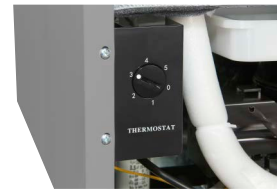
Thermostat Einfache Regelung der Temperatur erfolgt mit dem Schalter.